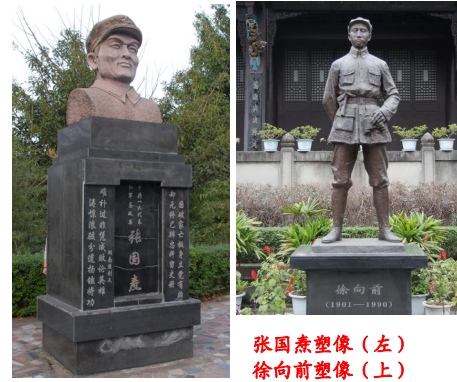
张国焘塑像（左） 徐向前塑像（上）

1935年1月22日，红四方面军为执行中央命令北上抗日，发动了陕南战役，调动敌人北移，随即回师川北，成功的取得强渡嘉陵江的胜利，并乘胜向西进攻，解放了涪江与嘉陵之间的大片土地，有力地策应了中央红军北进入川的作战战略，为争取与中央红军会师共同北上抗日，红四方面军踏上了艰苦曲折的长征征途。