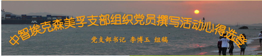
党支部书记 李博玉 组稿